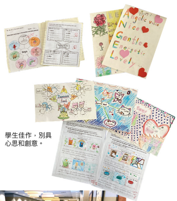
學生佳作，別具心思和創意。