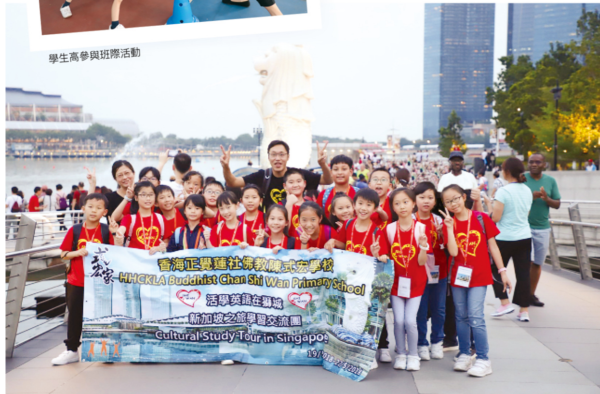
翱翔國際 - 新加坡環保學習之旅