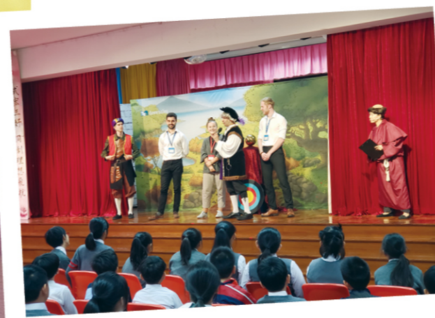
外籍老師化身演員與學生一同演出話劇