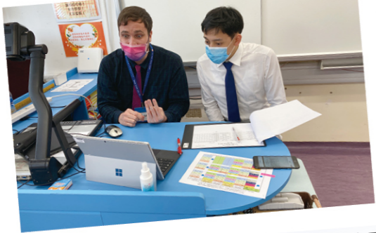
外籍英語老師以視像個別分享升中面試技巧