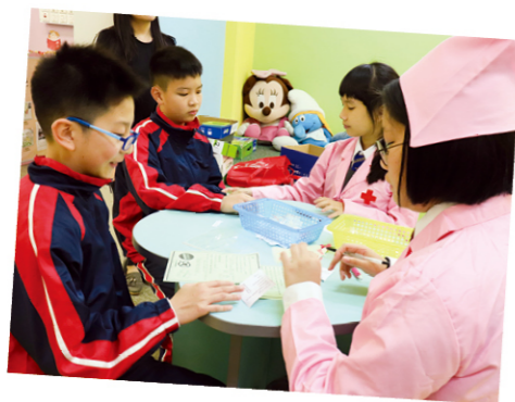
英語大使化身醫護人員以英語問診