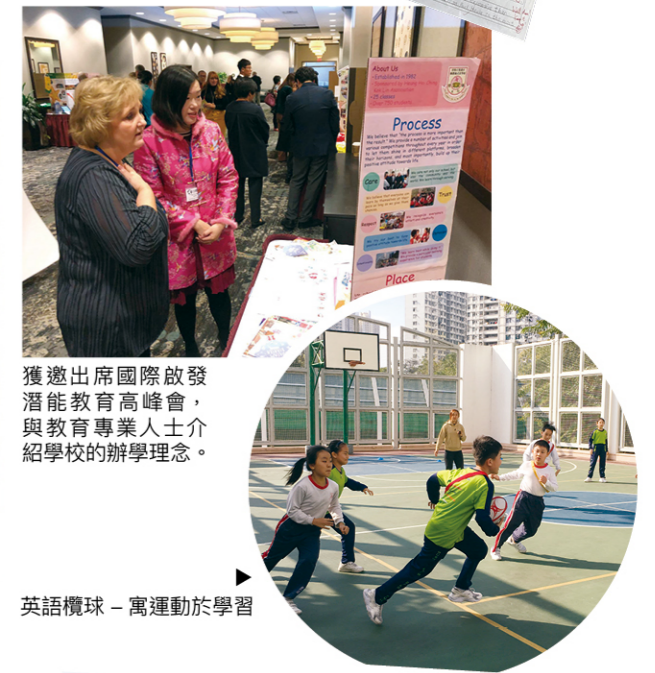
獲邀出席國際啟發潛能教育高峰會，與教育專業人士介紹學校的辦學理念。