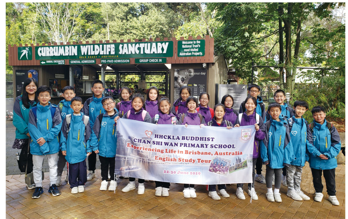
寰宇課程 - 澳洲生活體驗之旅