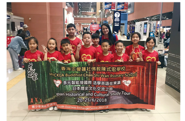
環球遊蹤 - 日本歷史文化交流之旅

學校鼓勵學生參與多元化英語活動，他們在英文朗誦、英語話劇比賽、辯論等屢創佳績，於香港學校戲劇節共奪得 14 個獎項，成績驕人。學校亦推薦學生積極參與 TOEFL、亞洲英文大賽、劍橋英語等公開考試及比賽，增值自我。更有英語檯球、英語大使接待外賓、Winter Fun Fair 等活動，給予學生不一樣的學習經歷。學校亦經常為學生籌組遊學團，遠赴日本、澳洲、新加坡等地，透過與當地人士的互動交流，打破疆界，體驗國際文化之餘，更會投身當地社區服務，由學生以英語將香港特色、民生風俗和靜觀文化與當地人士分享。