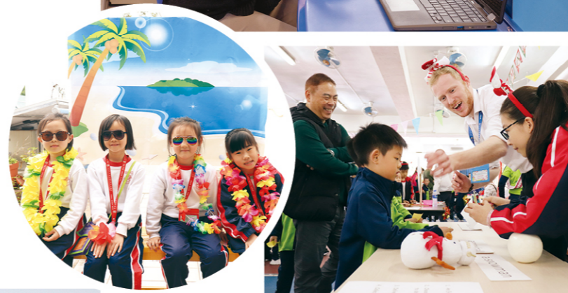
英語體驗日 - 夏威夷陽光之旅