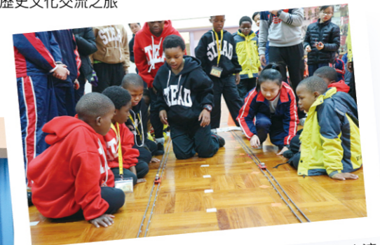
與非洲學童進行連年交流