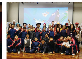
向專業英語音樂劇演員學習