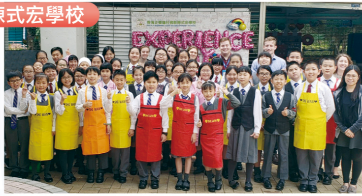
英語大使整裝待發，在英語體驗日施展渾身解數。