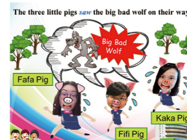
多元互動英語學習網課：校長、老師、職工和學生粉墨登場，營造出「只此一家」的英語網課。