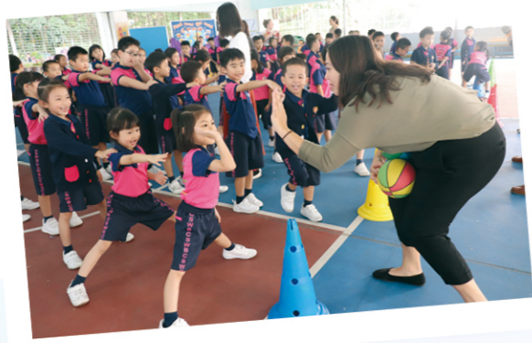
學生高參與班際活動

學校的英文科教學成效顯著，備受業界肯定，新加坡教育團便曾特地到訪該校，觀摩英文科教學課程和特色。學校更連續兩年獲邀到香港教育大學分享英文教學經驗。此外，並喜獲北京賽課的一等獎，以及被「國際啟發潛能教育聯盟」嘉許為「國際啟發潛能教育學校大獎」，該校英文科科主任於高峰會中向世界各地學校介紹該校的教育理念，互相啟發。