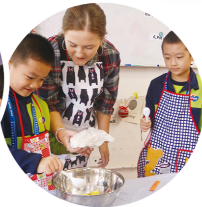
充滿趣味的體驗式學習