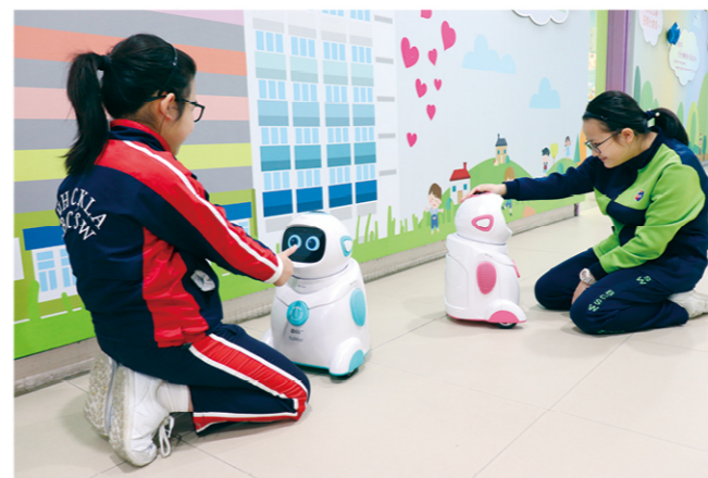
學生與機械人進行有趣的英語遊戲和互動