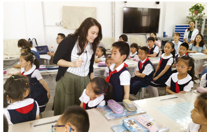
北京賽課喜獲一等獎