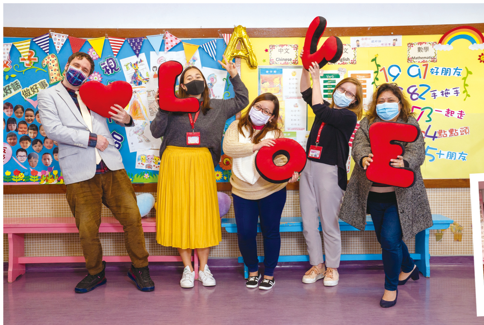
充滿活力童真的外籍英語老師

此外，學校 5 位外籍英語老師來自不同國家，各有專業，覆蓋藝術、音樂、科學及講故事等範疇，將世界不同文化特色澆灌給學生。該校一半以上課堂有外籍老師施教，以小組形式授課，在教學主題中滲入音樂、語言藝術、電子媒體等不同元素，更會涉獵不同有趣生活主題，藉以豐富學生對世界大事和不同文化的知識。外籍老師會定時製作介紹各地文化的有趣短片，讓學生保持學英語的興趣，促進自主學習。