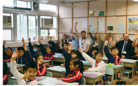
與來自世界各地的教育專家一同上課——珍貴、獨特和有趣的體驗。